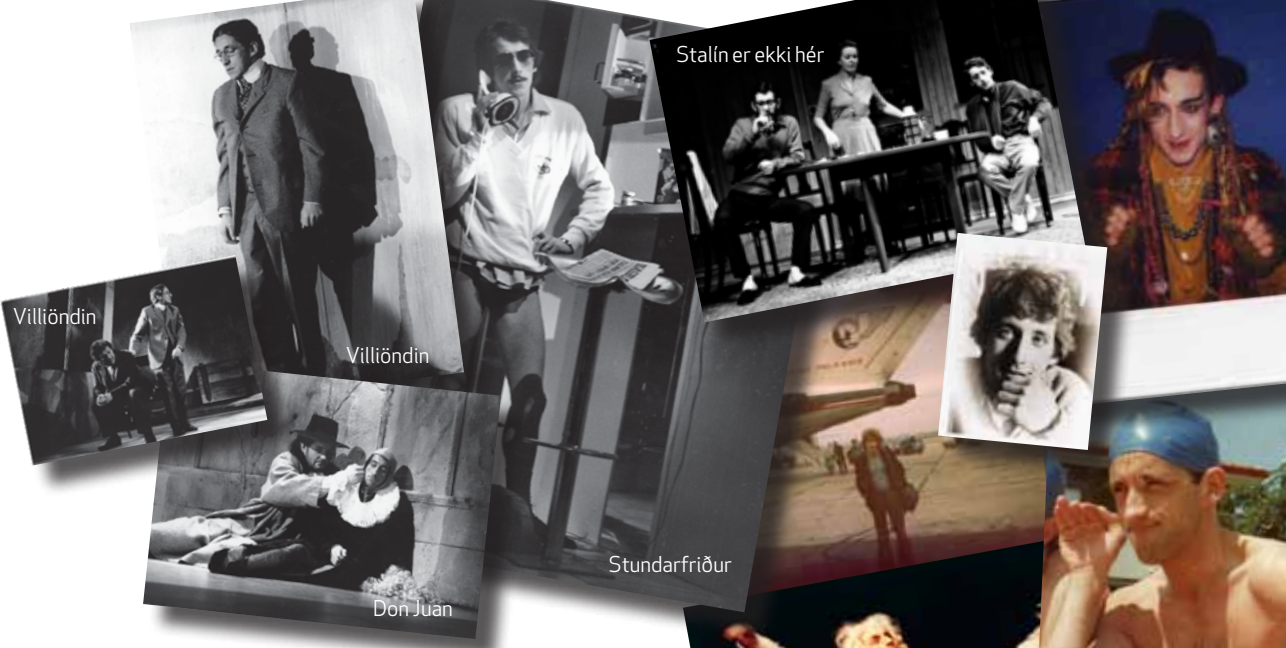
Stalín er ekki hér