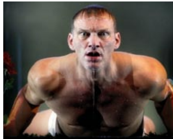
Fló á skinni